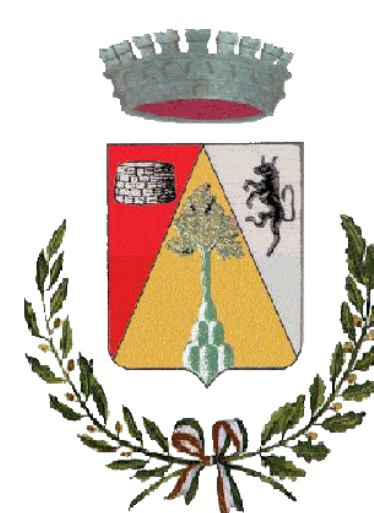
Comune di Nule