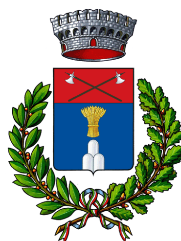
Comune di Anela