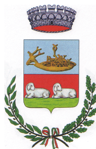
Comune di Bultei