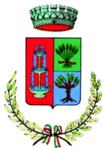
Comune di Benetutti